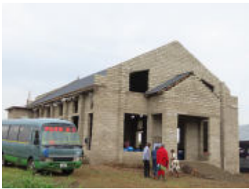
Im Bild: Kirchenneubau in Meru

Das legte Bischof Elias Kitoi Nasari bei der Einweihung des neuen Kirchengebäudes der Gemeinde Samaria im Süden der Meru-Diözese nahe. Selbst wenn eine Gemeinde erst mit einem kleinen Kirchengebäude beginnt, sollte sie damit rechnen, dass sie in wenigen Jahren ein größeres braucht. Darum ist es sinnvoll, erst einmal am Rand des Grundstücks zu bauen.