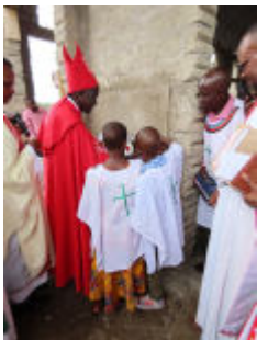
Im Bild: Bischof Nasari weihet eine neue Kirche ein

Neue Kirchengebäude und Gemeindegründungen sind in der Meru-Diözese nicht selten. Die Zahl der Kirchenmitglieder steigt weiterhin an.