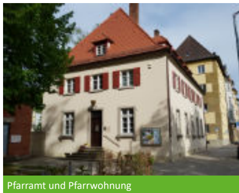
Pfarramt und Pfarrwohnung

Als die Erlöserkirche gebaut wurde, war der Kunigundendamm noch ein echter Damm, und der Bauplatz lag auf einer Höhe mit dem, was heute das Adenauerufer ist. Der Architekt entschied sich damals, die Kirche