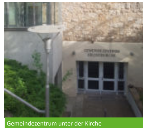
Gemeindezentrum unter der Kirche

geändert. Die letzte große energietechnische Neuerung kam mit der Umstellung der Kirchenheizung im Jahr 2006 von einer Warmluft- auf eine Warmwasserheizung im Fußraum unter den Bänken. Das war nicht nur finanziell ein wichtiger Schritt, es sollte auch die Wärme direkter zu den Gottesdienstbesuchern bringen.